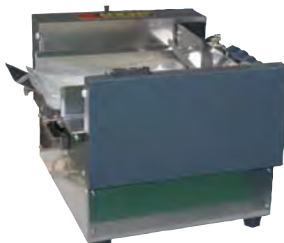
オートフィーダーAFB-350Ⅱ