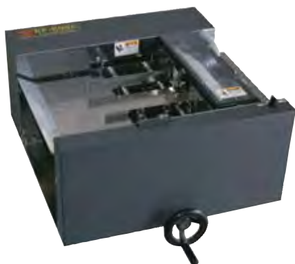
エレベーターエアフィーダー EF-500A エレベーターフィーダー EF-500