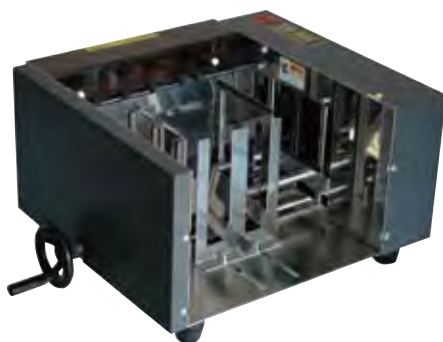
エレベータースタッカーES-500